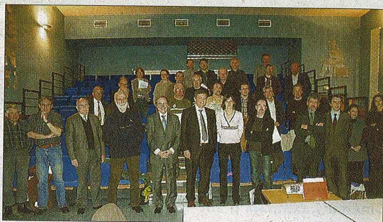
Les membres de la commission locale de l'eau réunis salle Claude-Temmem.

devra impulser les actions à entreprendre et les grandes directions à donner. Ceci dans une multitude de domaines : la maîtrise des ouvrages, l'entretien et la restauration des cours d'eau, les